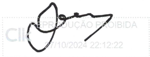
Italo Capraro Suariano 27 out 2024, 22-12-23.png